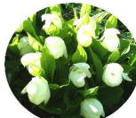
レプンアツモリソウ