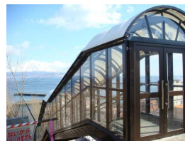
通学路「学校坂道」より