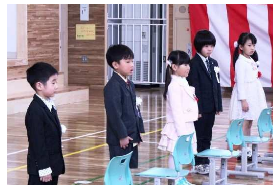
▲礼小っ子の仲間入りをした元気いっぱいの新1年生